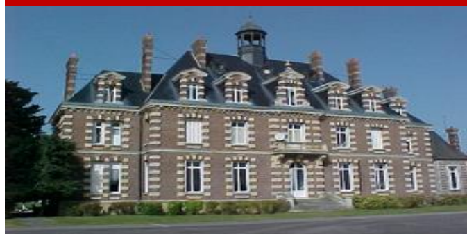
VIE AU COLLEGE